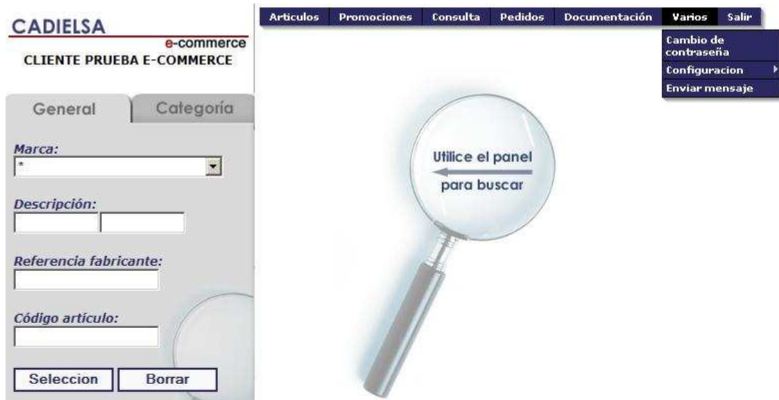
Figura 27: Varios.