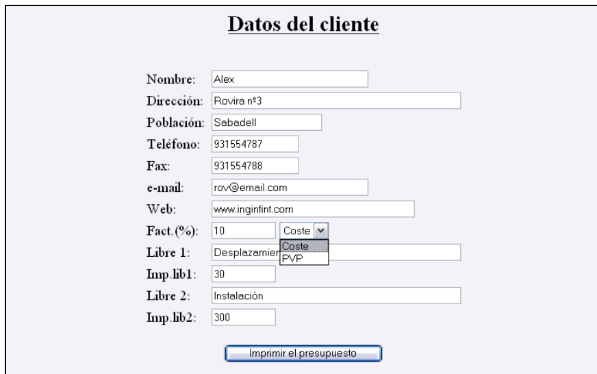
Figura 14: Datos personalizables para la impresión de la oferta.

Esta impresión está pensada para dirigirla a los propios clientes finales, de modo que se ofrece la oportunidad de personalizarla antes de su impresión definitiva. Para ello, podemos cumplimentar los siguientes datos: