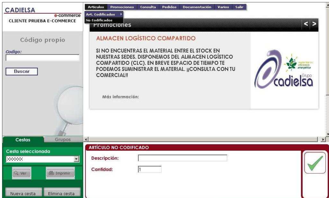
Figura 11: Añadiendo artículos no codificados a nuestro pedido.

En algún caso es posible que sea necesario pedir un artículo que CADIELSA no tiene en su base codificada. Para ello iremos al menú Artículo y pulsaremos en el Submenú No codificados con lo que aparecerán la siguiente pantalla: