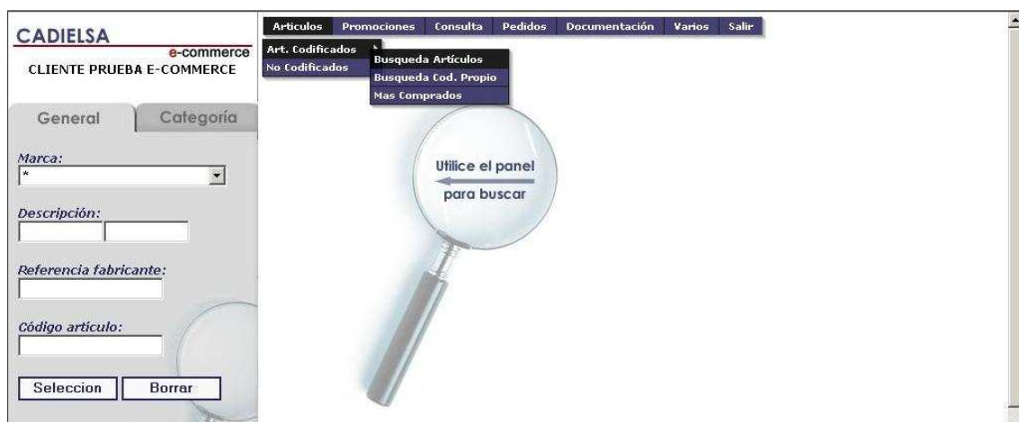
Figura 5: Búsqueda de artículos.

Al pulsar "Artículos" veremos dos submenús, artículos codificados y no codificados, si pulsamos sobre codificados accederemos a los artículos de CADIELSA, se abrirá otro submenú con búsqueda de artículos (general y por categoría), por código propio y más comprados.