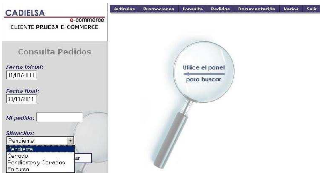
Figura 24: Consulta de pedidos.

Pulsando selección aparecerán los pedidos que cumplen las condiciones. De nuevo pulsando el código de pedido, tendremos las líneas en las cuales se presenta las unidades pedidas y los pendientes en cada momento.