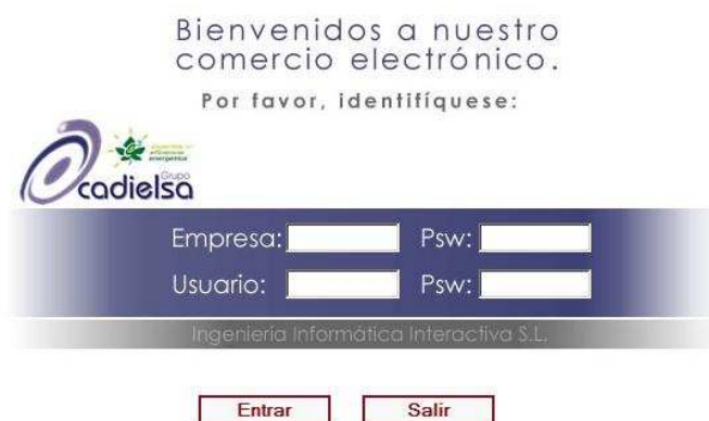
Figura 1b: Acceso a e-commerce 4.0

Par Acceder al E-commerce 4.0, se realizará a través del Link de Acceso, inmediatamente se abrirá una nueva ventana en la que se solicitará una serie de datos para permitir entrar en el servicio, estos datos son: identificador de empresa, clave de empresa, identificador de usuario y clave de usuario. Si tenemos más de un usuario todos tendrán el mismo identificador de empresa, pero diferente identificador de usuario.