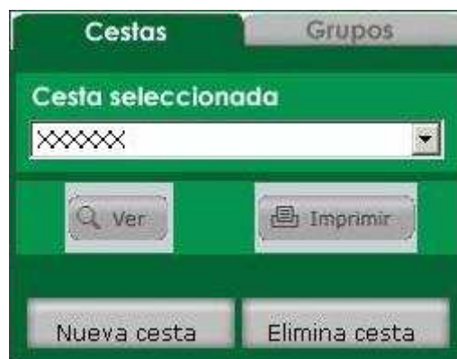
Figura 13: Impresión de una oferta

Como herramienta suplementaria, e-commerce 4.0 nos permite la impresión de una oferta en base a la cesta (Pedido) que tengamos activo en ese momento, para entregársela a un cliente de nuestro cliente. En la siguiente imagen puede verse claramente el botón de impresión de oferta ("imprimir"):