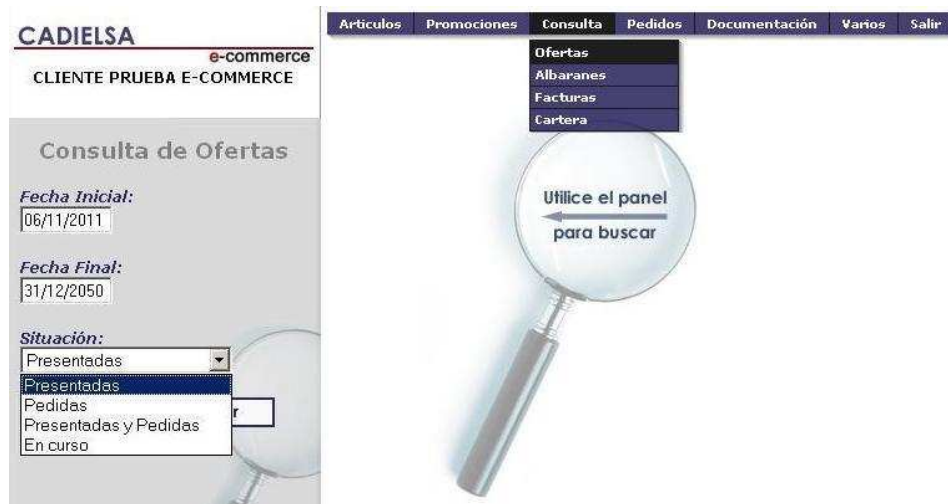
Figura 18: Consultas.

Pulsando la opción de "Ofertas" en el menú consulta, aparecerá la siguiente pantalla: