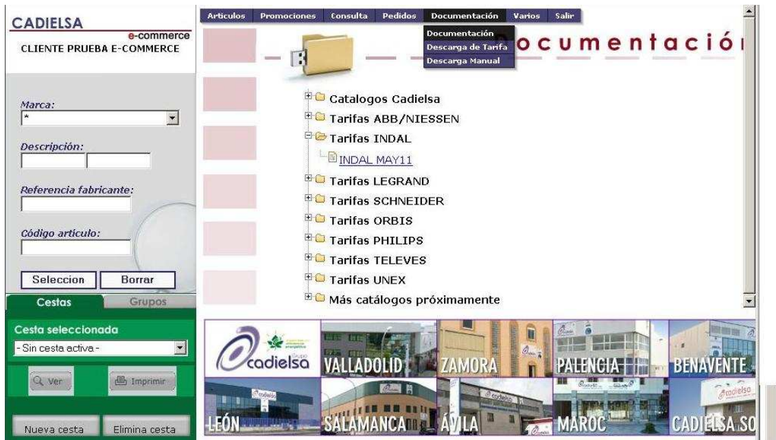
Figura 26: Selección de la tarifa.

Esta opción nos permite descargarnos en nuestro ordenador tanto los catálogos de cadielsa como las tarifa de precios de los principales Proveedores con los que trabaja el GRUPO CADIELSA.