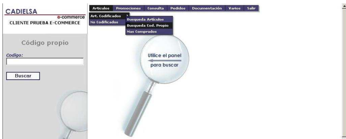
Figura 10: Búsqueda de códigos propios.

El sistema permite que se realicen búsquedas de artículos no con el código CADIELSA, sino con un código que hayamos creado nosotros mismos. Si pulsamos búsqueda por código propio aparecerá la siguiente pantalla: