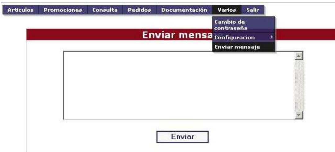
Figura 31: Envío de un mensaje .