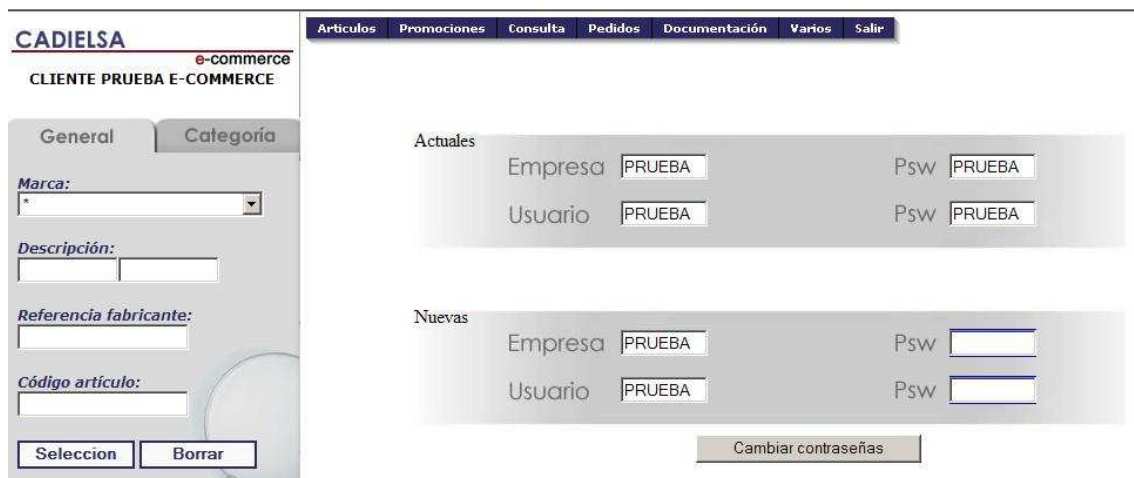
Figura 28: Cambio Contraseña.

El usuario tiene la posibilidad de Cambiar su contraseña en este apartado.