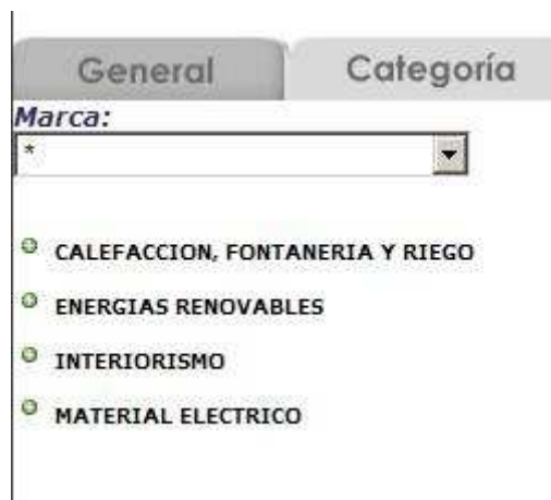
Figura 9: Búsqueda por categoría de artículos.

Existen tres niveles, empezando en nivel 1 con cuatro categorías ("Calefacción, Fontanería y Riego", "Energías Renovables", "Interiorismo", Material Eléctrico"), una vez seleccionado el último nos mostrará todos los artículos que tenemos asignados a esta categoría, igual que anteriormente y actuaremos también igual para pasarlo al pedido. A su misma vez seleccionando antes la Marca podremos acotar aun más el campo.