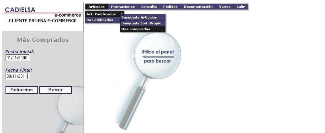
Figura 9: Búsqueda de más comprados.

Esta opción nos presenta una pantalla de selección en la que se nos pide un rango de fechas a considerar.