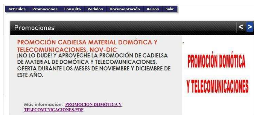
Figura 15: Promociones.

En el submenú promociones tenemos tres opciones: promociones, artículos en oferta y ofertas por categorías. En la parte de promociones podrá visualizar las promociones en vigor de cadielsa, pudiendo descargar el pdf, para contemplar los detalles de las promociones.